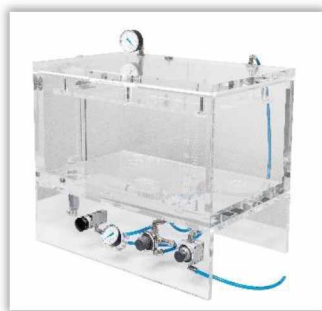
Тестеры герметичности по Вашим требованиям